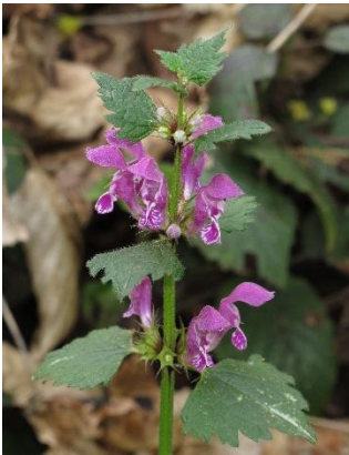
Rote und weisse Taubnessel