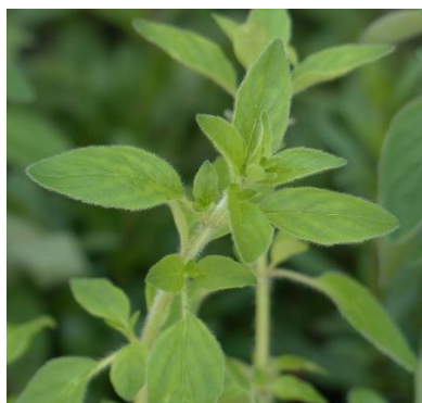
Dost (wilder Majoran)